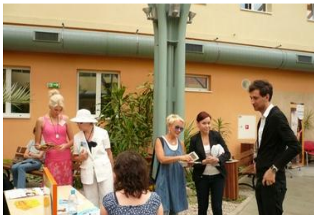
Ogród zimowy – konsultacje firm kosmetycznych