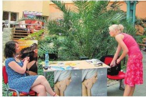
W atrium Wielkopolskiego Centrum Onkologii będzie można poznać tajniki zdrowego życia