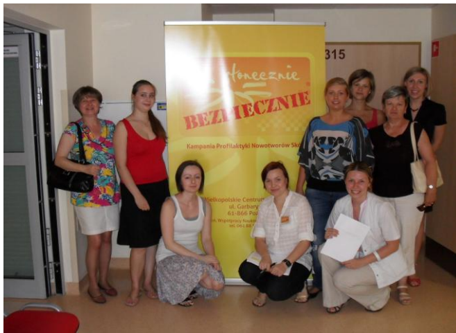
Uczestnicy kampanii w oczekiwaniu na badanie skóry